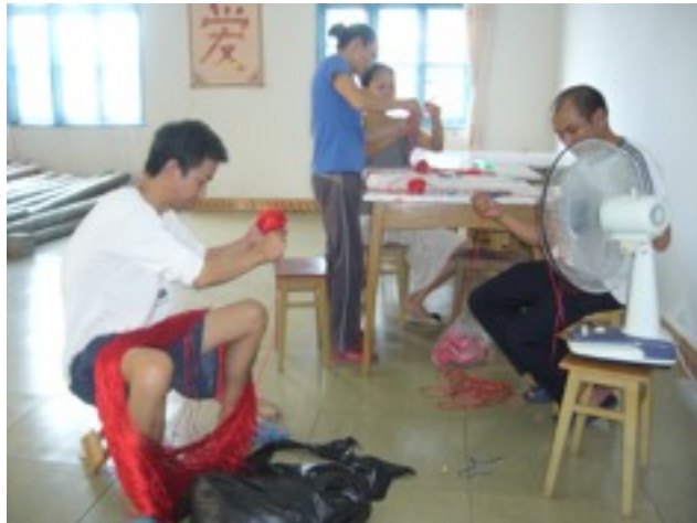
兩位康復者在幫忙纏做中國結用的線