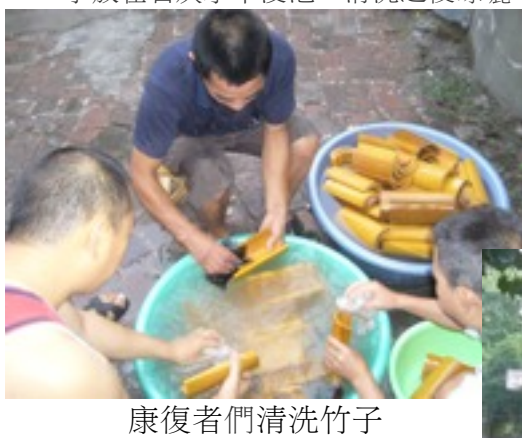
康復者們清洗竹子

七、按本地的製作的方法，竹子要在石灰水中泡，才不會生蟲，康復者們將劈好的竹子放在石灰水中浸泡、清洗之後晾曬。