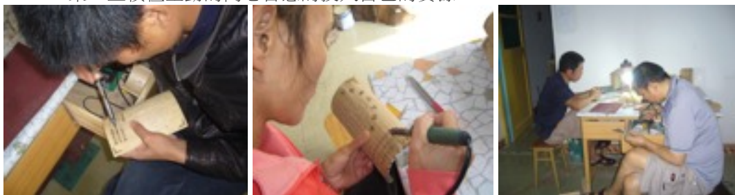
康復者們、修女、志工在燙字

十一、由兩位康復者、一位志工、兩位修女開始在印好的竹板上燙字，這一次需要燙的字比較多，較去年難度大一些，但康復者們還是非常有信心，雖然有的康復者手不是那麼靈活、有時手還會發抖，但他們還是非常認真的去燙好每一筆，我們預期在九月低交貨，之前計劃燙的數量卻與實際燙的數量有一點差距。我們有些著急，但是康復者們卻主動的加班加點，雖然時間很緊，但每一位都非常的喜樂，並積極主動的同心合意的投入自己的資源。