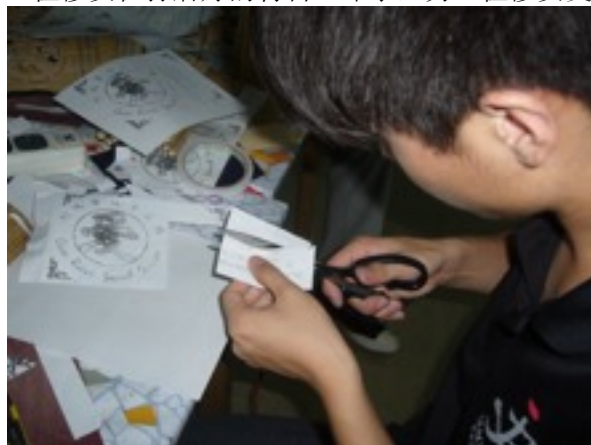
志工在做印字的準備