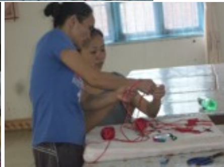
一位康復者在教給二位志工做中國結